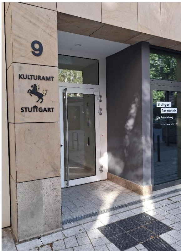
Kulturamts-Entrée, Eichstraße 9, graue Außenwand